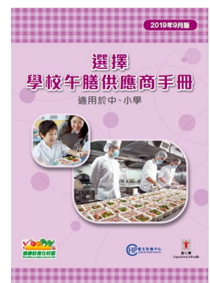
《選擇學校午膳供應商手冊》 (2019年9月版)

錯過了本學年第一場工作坊的校長及老師，特別是即將招標午膳供應商的學校，現在可把握機會，報名參與將於今年 11 月 13 日（三）下午 2 時至 5 時假九龍塘沙福道 19 號教育局九龍塘教育服務中心西座 3 樓 301 室舉行的第二場工作坊。你可透過教育局培訓行事曆報名，名額有限，先到先得。有關報名查詢，請與教育局彭女士聯絡（電話：3540 7436，電郵： pmlwl1@edb.gov.hk ）。