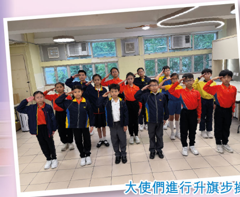
大使們進行升旗步操訓練，動作劃一整齊