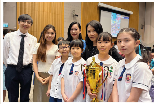
是次獲獎充分肯定了學校在培育學生、推動國安教育方面的努力。