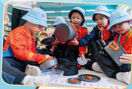
營具帶來滿滿的新鮮感