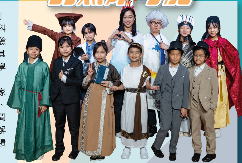
八位智者和發明家來了朱正賢小學，帶領學生初探科研

活動中，八位中外歷史上赫赫有名的智者與發明家「活」了起來，包括孔子、諸葛亮、鄭和、詹天佑、畢昇、阿基米德、萊特兄弟和伽利略。他們在主題房間中親自為學生與家長展示非凡技藝與智慧，讓大家理解科技發展並非一蹴而就，而是源於無數次的嘗試與積累，從而引導學生感恩並珍惜現有的一切。每場活動都深受學生和家長的歡迎，大家對各個環節讚不絕口，學生們更是流連忘返，不願離去。