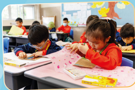
製作獨一無二的營旗