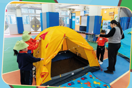
佈置帳篷真不容易啊！