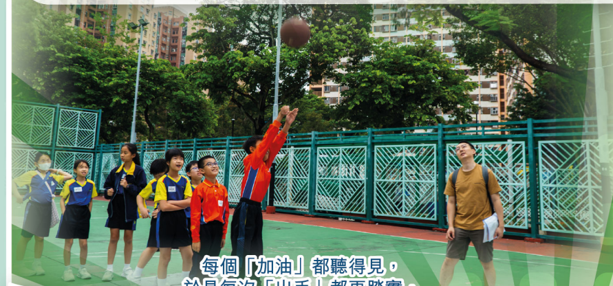
每個「加油」都聽得見，於是每次「出手」都更踏實，向更勇敢的自己招手

五年級學生早前於沙田展開一日「城市定向成長體驗」，以真實社區作為教室。學生透過規劃路線與團隊解難中探索社區脈絡與地標故事。活動涵蓋城市定向、團體闖關與室內歷奇等挑戰，讓學生在合作協商、角色分工與時間管理挑戰中，實踐自律與互助。學生一邊在城門河、車公廟、文化博物館一帶完成 Check Point，一邊把課本知識連結到生活，培養團體精神與公民素養。他們在師長的陪伴與引導下，學會以溝通解難、尊重守規、安全為先的態度，逐步完成各項能力所及的挑戰，並在一次次嘗試中建立自信心與堅毅的精神！