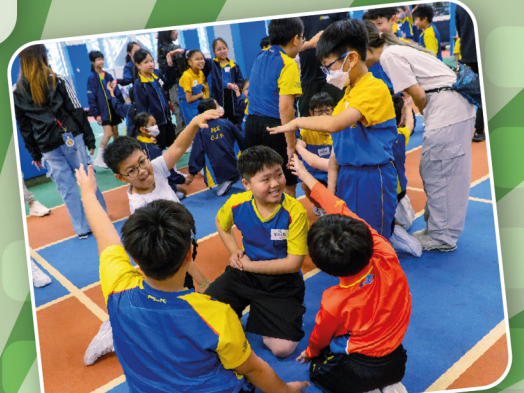
摸索的每一步，都是團隊默契的註腳，我們就是最美的圖畫