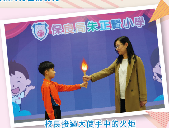
校長接過大使手中的火炬

大使們肩負莊嚴且重要的職責。他們會在早會或典禮中執行升國旗儀式，以嚴肅的態度和整齊的動作，體現對國家的尊重與熱愛。此外，大使們亦會在早會上進行「國旗下講話」，向全校師生分享與國家相關的主題，例如國家發展動態、中華文化精髓及中國歷史等。不僅如此，他們亦會積極參與和協助推動校本國民教育學習活動，特別是在國家憲法日、國家安全教育日等重要日子，以強化學生對國民身分的認同與公民責任的意識。