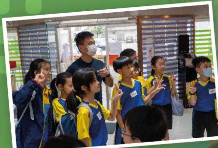
老師在旁，既是我們的靠山，也是方向牌，我們與最好的同行者一起見證每個微小的突破