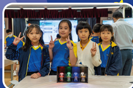
同學們透過小組學習，成功完成實驗，展示成果