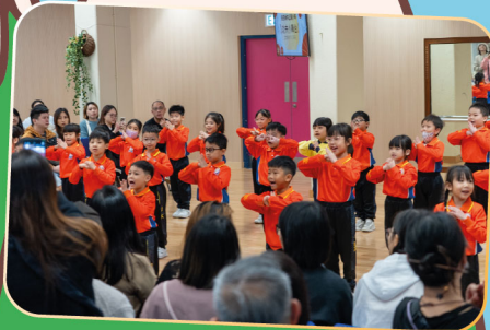
家長就在面前，同學認真表演功夫