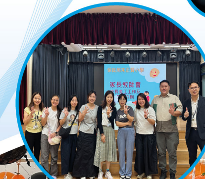
不同組別的家長義工