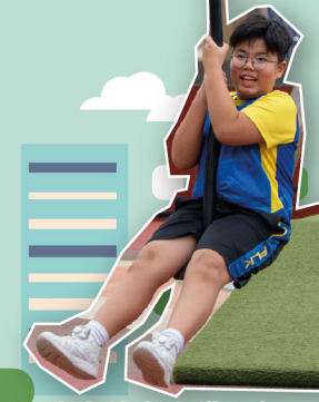
汗水與笑容交織，每一步都是戰勝自己的證明，這不只是一場比賽，更是一次毅力的試煉

五年級學生早前於沙田展開一日「城市定向成長體驗」，以真實社區作為教室。學生透過規劃路線與團隊解難中探索社區脈絡與地標故事。活動涵蓋城市定向、團體闖關與室內歷奇等挑戰，讓學生在合作協商、角色分工與時間管理挑戰中，實踐自律與互助。學生一邊在城門河、車公廟、文化博物館一帶完成 Check Point，一邊把課本知識連結到生活，培養團體精神與公民素養。他們在師長的陪伴與引導下，學會以溝通解難、尊重守規、安全為先的態度，逐步完成各項能力所及的挑戰，並在一次次嘗試中建立自信心與堅毅的精神！