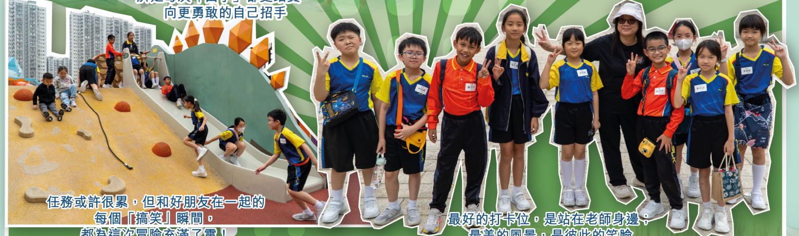
任務或許很累，但和好朋友在一起的每個「搞笑」瞬間，都為這次冒險充滿了電！