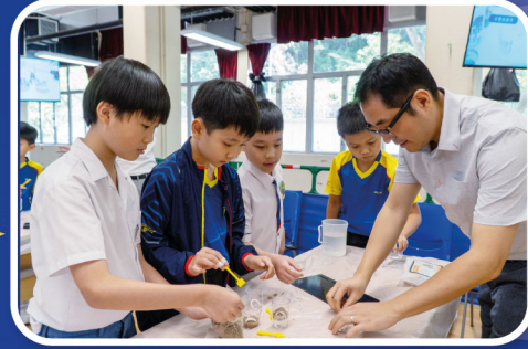
學校師生於課堂進行學與教交流，增進學習效能

課程目標是讓學生認識科學教育，激發學生對科學探究的興趣和培養創新意識，並讓學生能夠體會光線、土壤相關的科學實驗探究過程對學生科學素質提升的重要意義。