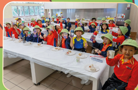
不用火，不用電，大家也吃飽飽