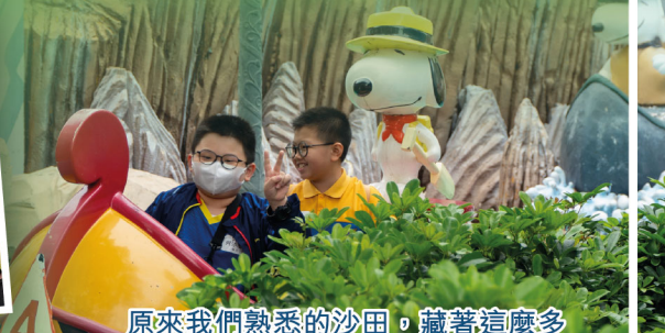
原來我們熟悉的沙田，藏著這麼多我們不知道的風景。城市就是一本讀不完的教科書，今天我們翻開了最有趣的一頁