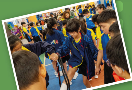
室內闖關，腦袋和勇氣齊齊上線，靜默溝通，高效合作，靜靜地完成大挑戰