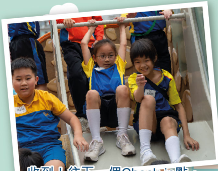
收到！往下一個Check-in點，全速前進！我們的足跡，就是沙田最具活力的風景線