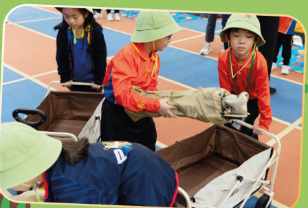
分工合作運送物資