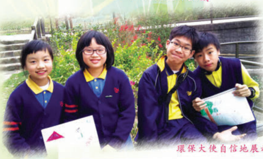
環保大使自信地展示自己設計的動植物圖