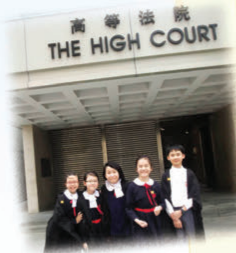
參加由香港善導會主辦之「模擬法庭・公義教育計劃」，本校小記者懷着興奮的心情到高等法院進行採訪