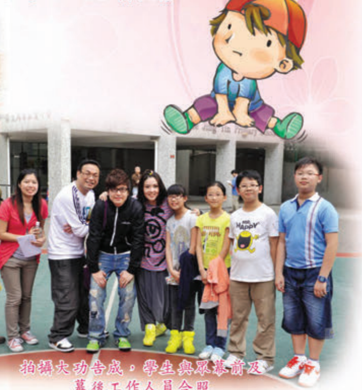
拍攝大功告成，學生與眾幕前及 幕後工作人員合照