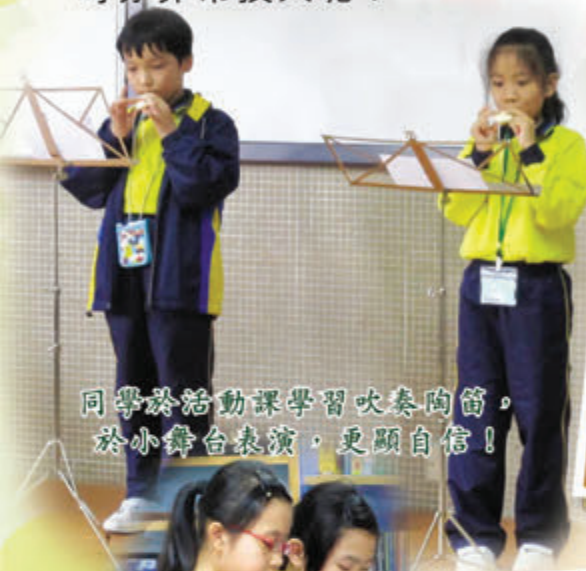
同學於活動課學習吹奏陶笛，於小舞台表演，更顯自信！

新學年，音樂室添新姿，牆壁除了重新佈置外，更增設一個小舞台，希望學生能在舞台上發揮所長。本年度更於午息時段舉辦了四次「音樂小舞台」的活動，增加學生表演音樂的機會，以增強他們對演奏音樂的信心，並培養他們的音樂感、音樂想像力和評賞能力。每次活動都吸引了不少同學前來觀賞，大家欣賞時亦非常投入呢！