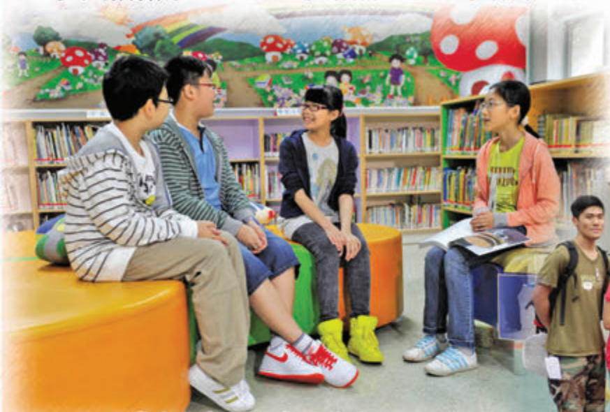
學生們都很認真的對稿， 準備稍後的拍攝