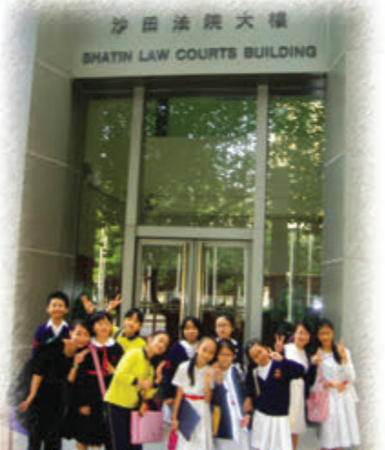
參觀沙田法院大樓，參與聆訊，了解香港的基本司法程序及應有的禮儀