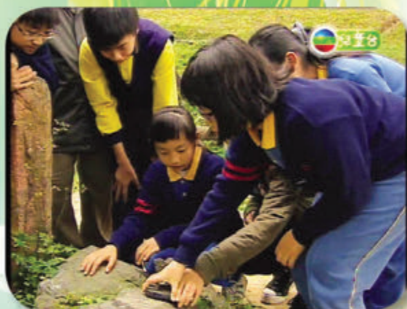
環保大使第一次接觸 自然形成的火山岩