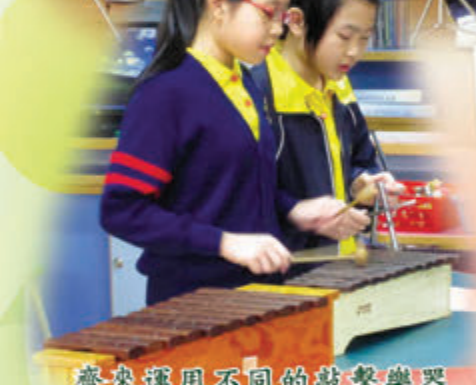
齊來運用不同的敲擊樂器進行合奏