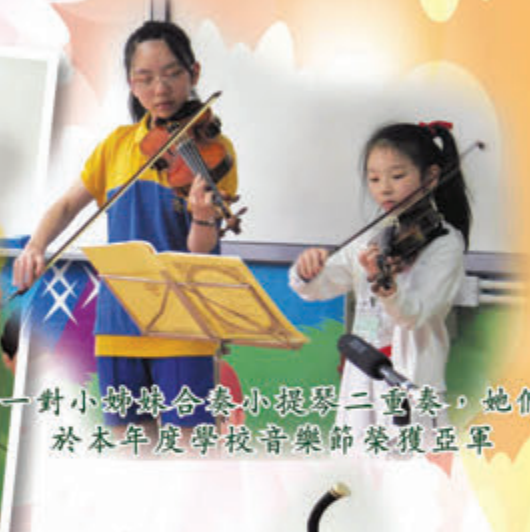
一對小姊妹合奏小提琴二重奏，她們於本年度學校音樂節榮獲亞軍