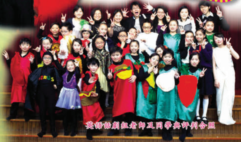
英語話劇組老師及同學與評判合照