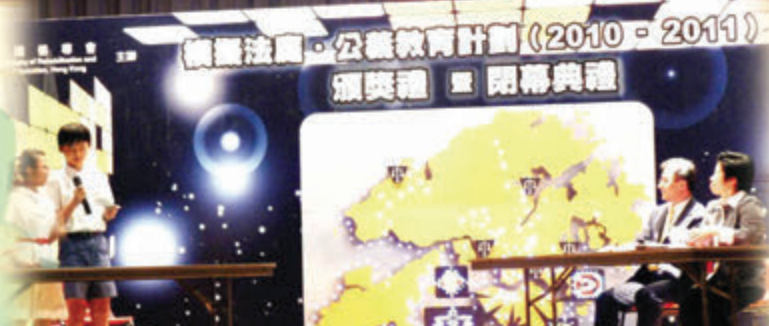
兩位小律師得到主辦機構及評判的賞識，被邀於頒獎禮上擔任表演嘉賓，以律師身份向法官及大律師進行盤問