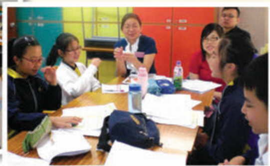
由資深的大律師擔任導師，帶領小律師們重組案情、組織盤問內容