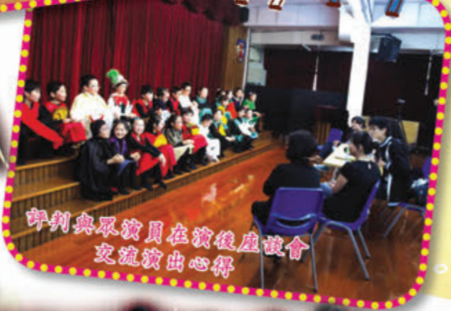
評判與眾演員在演後座談會 交流演出心得