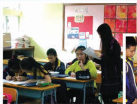
由傳理系大專學生擔任導師教授小記者撰寫新聞稿的技巧