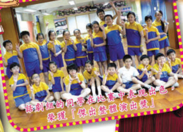
話劇組的同學在比賽中表現出色 榮獲「傑出整體演出獎」