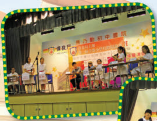
第二場辯論賽，辯題為「港府不應以放煙花的形式來慶祝大型盛事」

基於我校的辯論隊是首次參與辯論訓練及比賽，大家在沒有經驗的情況下，原本只敢抱着鍛鍊膽量、提升自信與思辯能力的目標盡力而為、「越級挑戰」。沒料到，大家越「辯」越起勁，越「辯」越愛這項活動。結果，竟連續在兩場辯論賽中成功以技術擊敗對手，當中更有組員贏得「最佳辯論員」的殊榮。這難得的經驗，教大家畢生難忘！