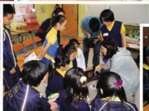
小記者們正專心致志地向專業攝影隊學習如何捕捉最佳拍攝角度的技巧