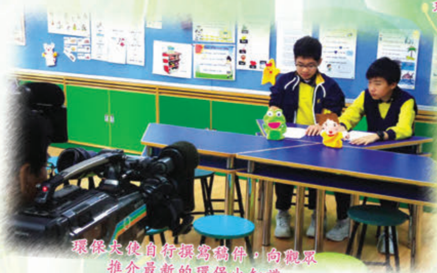
環保大使自行撰寫稿件，向觀眾 推介最新的環保小知識