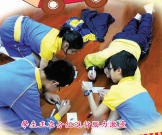
學生正在分組進行腦力激盪