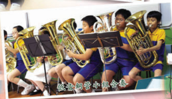
低音銅管小組合奏