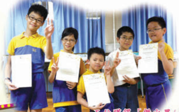
五位獲得「傑出男/女演員獎」的學生