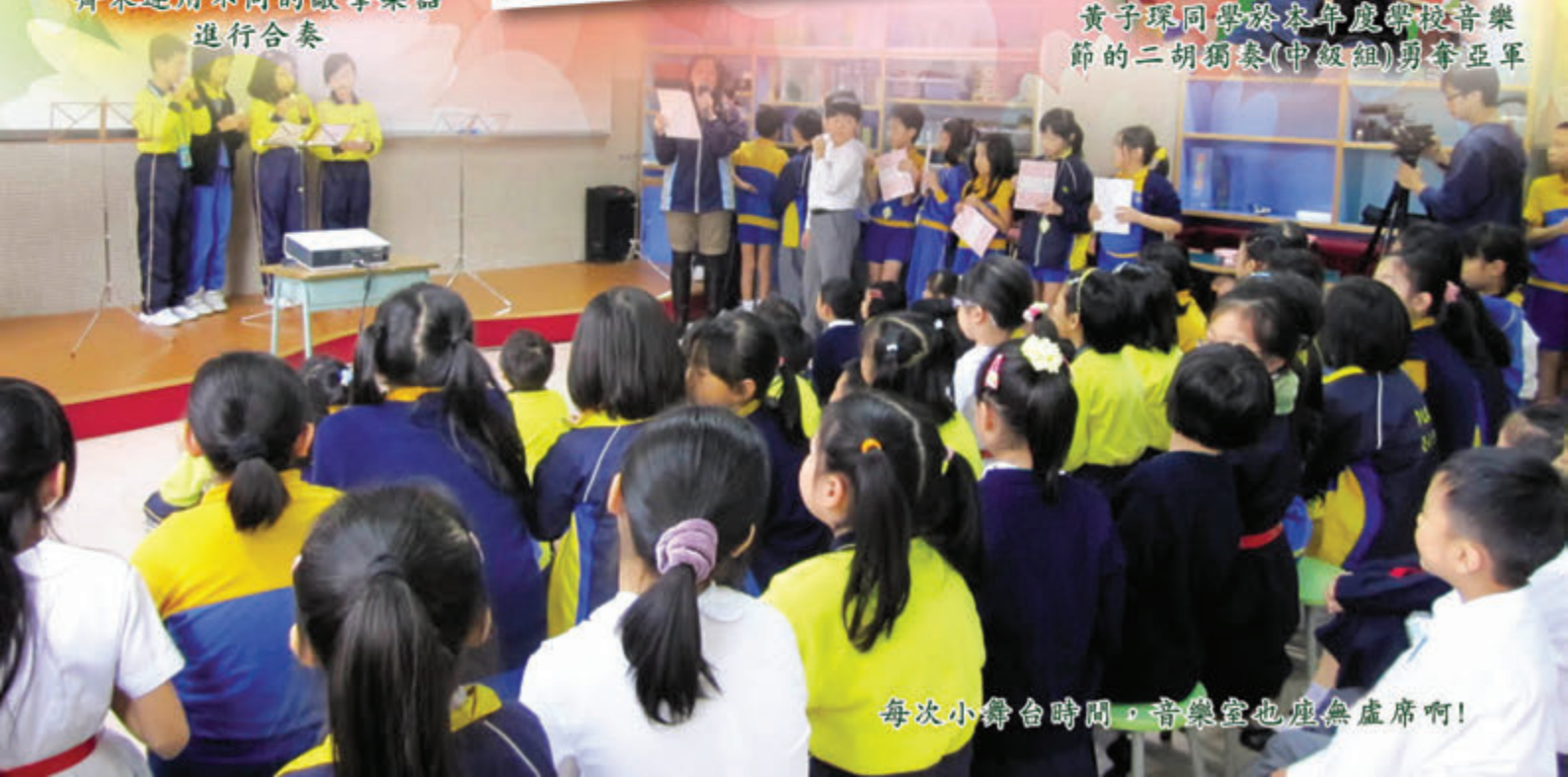
每次小舞台時間，音樂室也座無虛席啊！