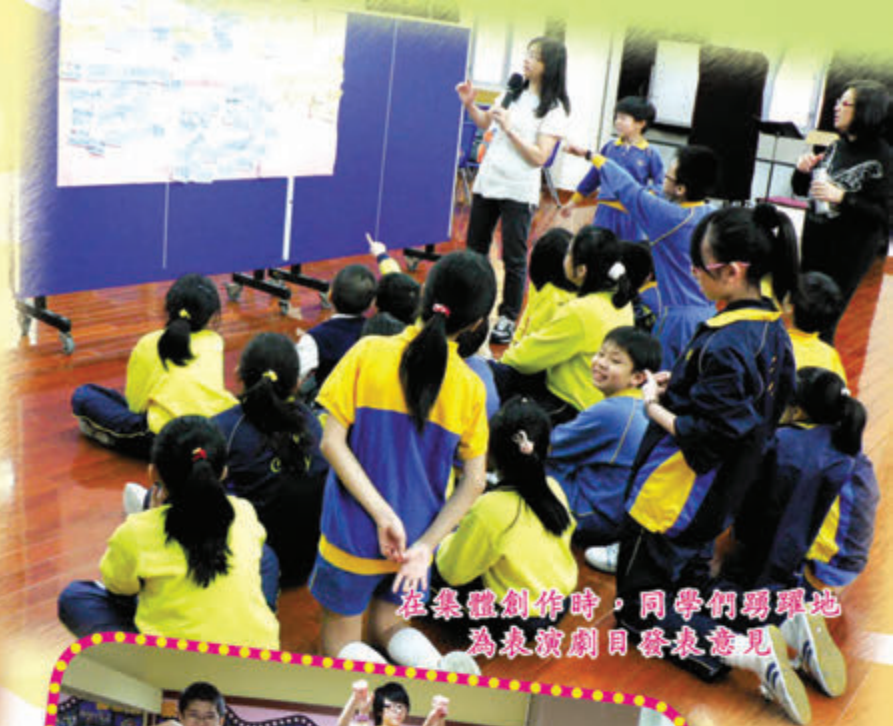
在集體創作時，同學們踴躍地為表演劇目發表意見