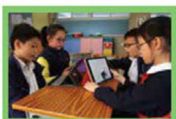
聽！教室裏書聲琅琅，原來同學們正投入地進行分組朗讀練習。