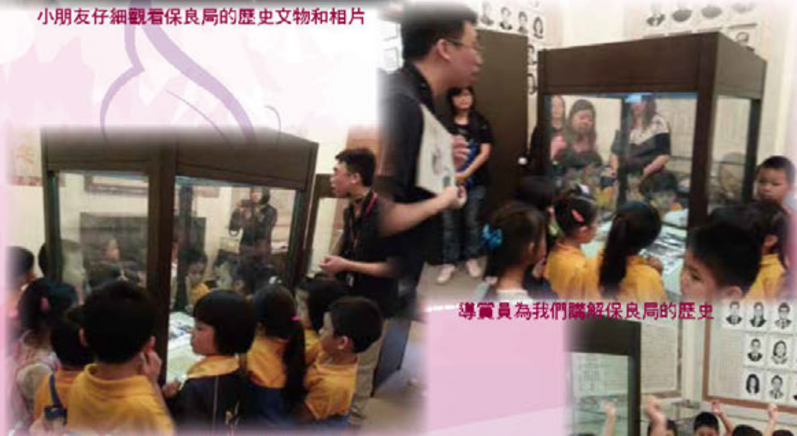
導賞員為我們講解保良局的歷史