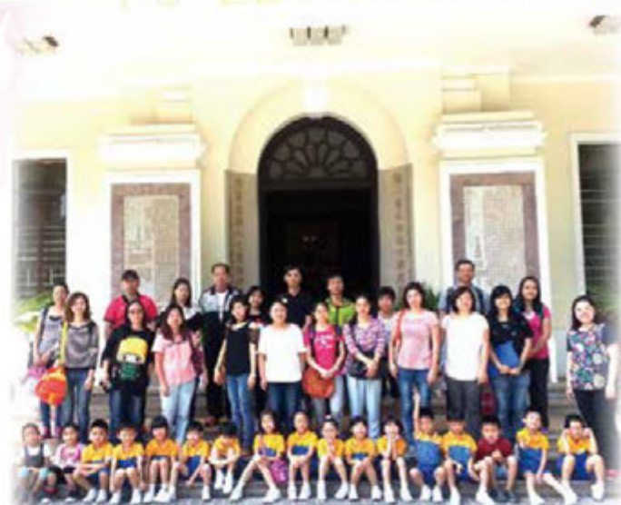
我們參觀保良局歷史博物館