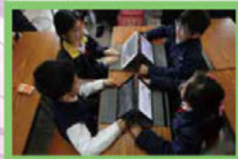
在課堂上，學生興高采烈地進行討論，互相分享意見。