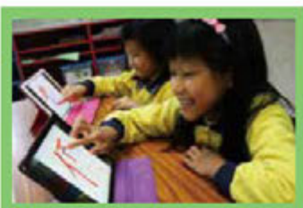
學生於課後聚精會神地利用電子書提供的筆順動畫進行練習、自學。