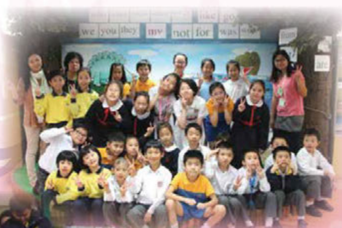
謝謝「識字小先鋒」及家長們教我認讀字詞