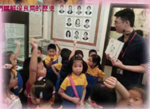
小朋友積極回答導賞員的提問