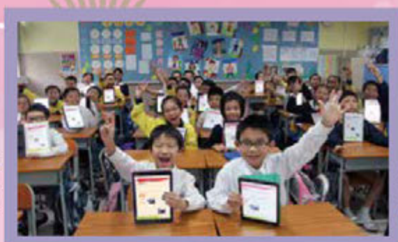
一人一機的英文課堂，真興奮！

電子書內滿佈「便利貼」，這是什麼？這便是老師給同學的筆記附件！同學甚至可自擬溫習筆記，附錄於電子書中，建立自己獨一無二的筆記簿。