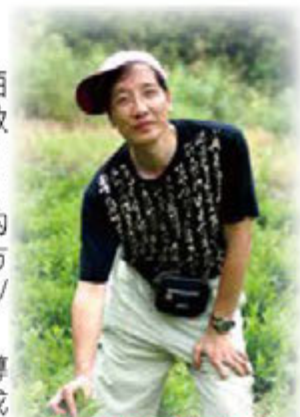
在江西婺源茶園採茶

最後，作為教師而同時身為一子一女的父親，我想指出一點，想有效地規管教導兒童，就要有一副「為人父母」的心腸，本著「幼吾幼以及人之幼」的精神去教養孩童，愛護學生就如同疼愛自己的子女一般，期望能夠將生命的價值傳承給我的學生和兒女，達到「教養孩童，使他走當行的道」的人生目標。