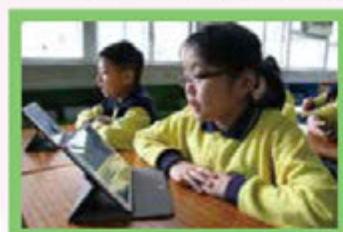
學生對電子學習感新鮮，專注力提升了！