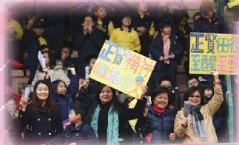
家長義工在運動會為「朱小」健兒吶喊