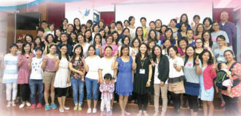
家長義工就職典禮

我的媽媽經常在學校做義工，去年學校運動會，媽媽為了參加教師家長接力賽，每天清晨一個人去練習。快到比賽前夕，我看見媽媽走路跟平時不一樣，我便問媽媽原因，她說她的肌肉拉傷了。我以為她不會參加比賽，誰不知到了比賽那一天，她竟出現在跑道上。雖然那次媽媽沒有取得名次，但我也為她感到驕傲。