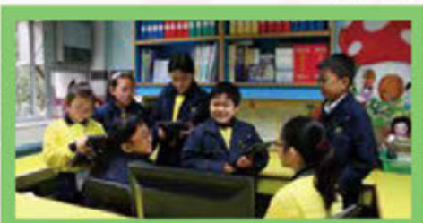
學生們只需攜帶輕便的平板電腦，就可以輕輕鬆鬆走出教室，進行寫作前訪問及紀錄，搜集一手資料。