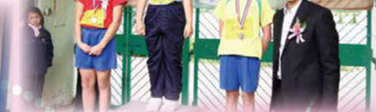
沙田區保良局小學聯合運動會