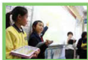
學生正充滿自信地與全班同學分享學習成果。

資訊科技既促進學生學習，也轉移了教學範式。看！在課堂上，同學們正利用平板電腦、電子書上課、討課、進行協作學習……使學習中文因此變得更有趣！富挑戰！高參與！回想過去，當學生於課後遇到不懂得讀或不理解的字詞時，他們只好問家長，或第二天回校問老師；時移勢易，今天，當我們的孩子在學習過程中遇到困難或想深入了解的課題時，他們只要手持平板電腦，便可隨時隨地翻開電子書，或於網上查找答案，進階閱讀；甚或把它拍攝下來作紀錄，與人分享……有助推動不同能力的學生因應個人學習進度，循序漸進，進行自主學習。