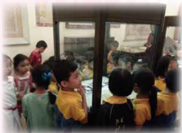
小朋友仔細觀看保良局的歷史文物和相片