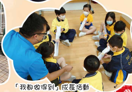
「我都做得到」成長活動