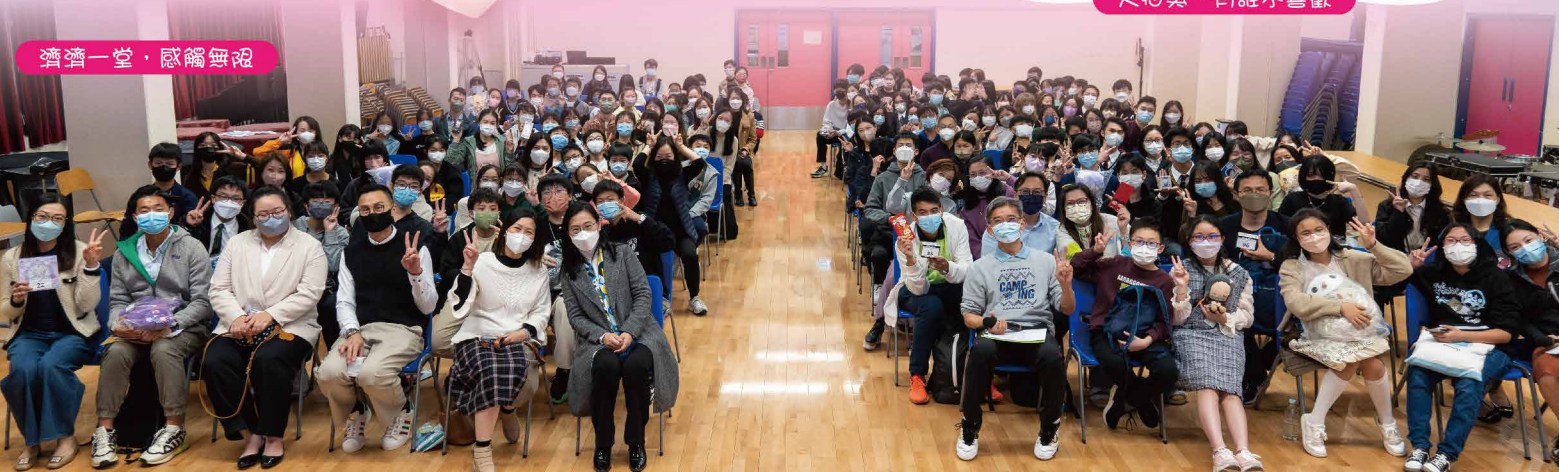
繼續一起，感恩無限