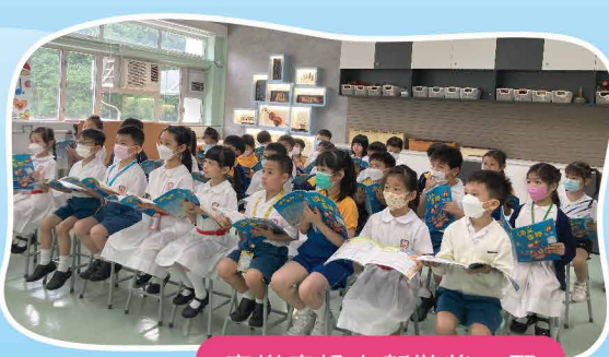
音樂室換上新裝後，配 置了互動電子白板，令 課堂更具彈性及趣味。