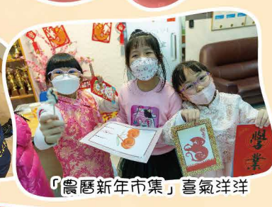
「農曆新年市集」喜氣洋洋