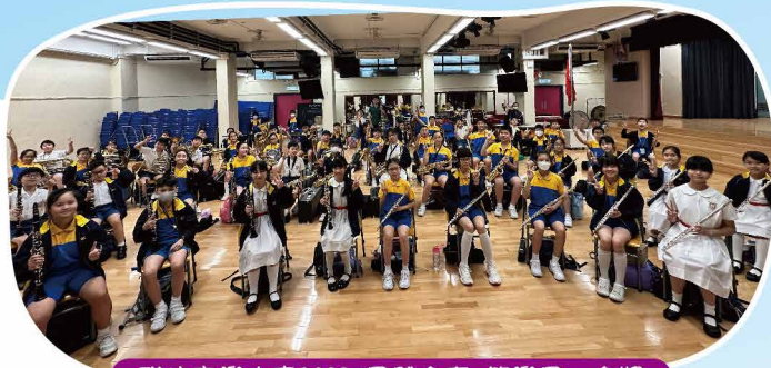
聯校音樂大賽2023 (團體合奏 管樂團) 金獎