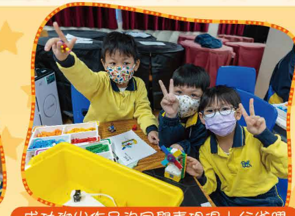
成功砌出作品的同學表現得十分雀躍