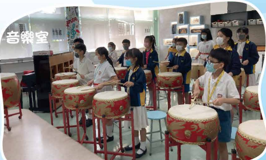
透過保良局李兆忠優質教育基金，學校開展了中華藝萃鼓 「樂」樂計畫，進一步改善音樂室空間，為學生提供更佳 的表演場地，以發揮學生不同的音樂潛能及傳承國粹。