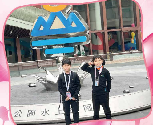
參加親子水上樂園活動，樂在其中