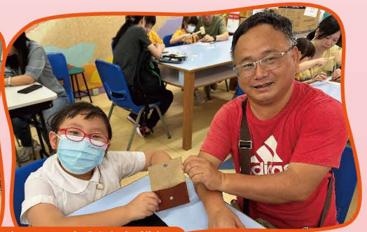
家長參加「親子正向工作坊」，一起製作小錢包