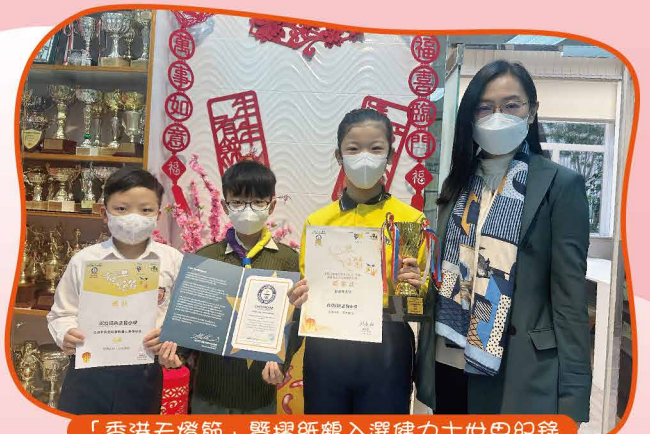
「香港天燈節」暨摺紙鶴入選健力士世界紀錄