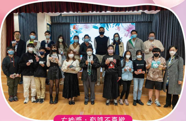
大抽獎，有誰不喜歡