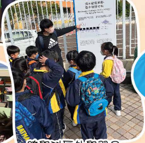
跨學科戶外學習日 (參觀蒲崗村道公園)