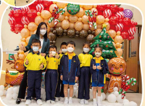
手工精美絕倫的聖誕佈置