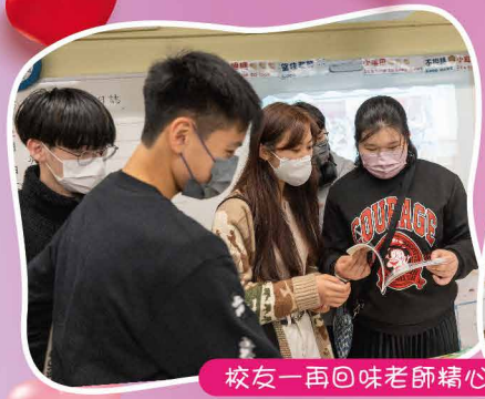
校友一再回味老師精心佈置的舊日回憶