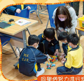
同學們努力進行測試、改良、再測試……