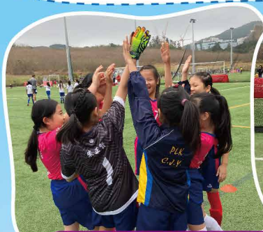
賽馬會女子青少年足球比賽2022-2023 (5人足球比賽十歲以下組別) 季軍

創意思維世界賽 香港區賽2023 (第一組別) 亞軍 同學更獲得到 美國參賽的 入場券！