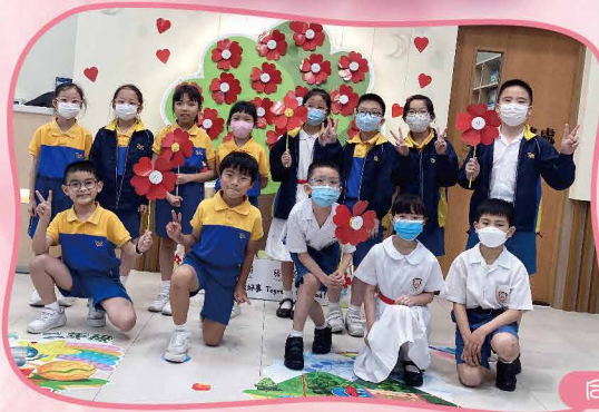
同學透過摺「小紅花」傳遞愛心，在母親節向母親表達謝意

保良局與騰訊基金會攜手合作，積極推動本地公益慈善活動。於2022-2023學年，藉騰訊基金會捐款並透過「與小紅花一起做好事」活動，讓同學實現夢想，並學習互相關心送暖。