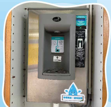
添置了兩部「紫外線殺菌飲 水機」，大受同學的歡迎。