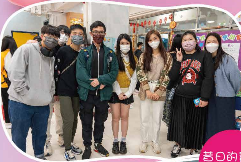
昔日的寶寶長大了