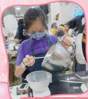
同學參加「親子一日遊」，體驗做蛋糕的樂趣