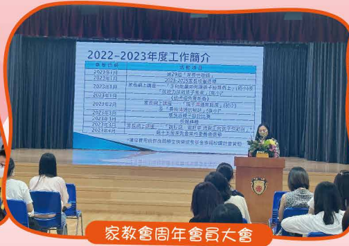
家教會周年會員大會