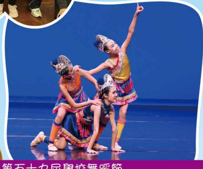
第五十九屆學校舞蹈節 (小學高年級 中國舞 三人舞) 甲級獎