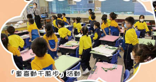
「臺臺動千萬步」活動