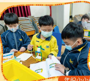
年紀小小的一年級也懂得與同學合作共達目標