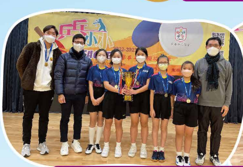
乒乓小小LEAGUE 2022-2023 (女子團體) 冠軍; (男子團體) 亞軍