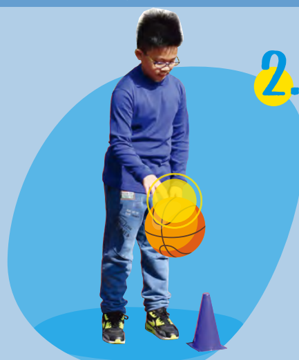
張開手指推球 (不是以掌心拍打球頂)