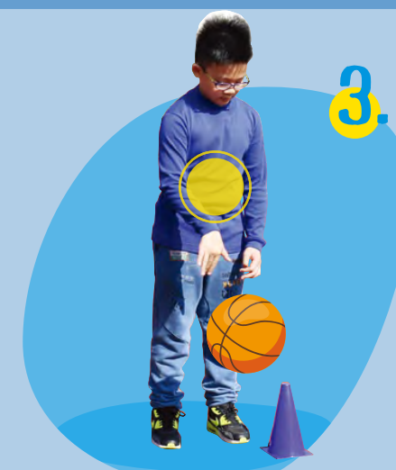
連續控球而無須移動雙腳